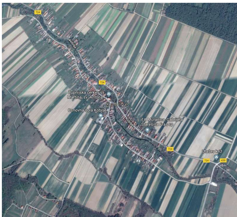
Slika 2: Vas Kobilje z glavnima cestama

Prometna varnost je vezana na obstoječe prometnice in sicer na medkrajevno cesto Dobrovnik – Kobilje – Motvarjevci, ki je na desni strani Kobiljskega potoka ter lokalno cesto skozi naselje, ki je na levi strani Kobiljskega potoka.