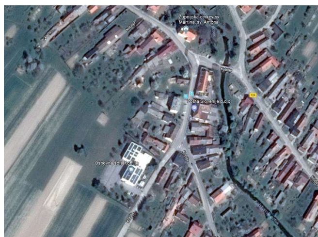
Slika 3: Pozicija stavbe vrtca in OŠ Kobilje

Šola se nahaja na vpadnici v vas in sicer iz smeri vasi Dobrovnik. Promet ob šoli je umirjen in redek , zato ocenjujemo, da so vse poti po katerih prihajajo učenci v šolo, varne. Ob celotni dolžini stavbe vrtca in osnovne šole je ob cestišču širok asfaltiran pas, ki služi kot pešpot oz. kolesarska steza. S ceste vodi šolska pot na šolsko dvorišče, ki je tudi parkirišče in naprej na šolsko igrišče, ki se ob večjih dogodkih (prireditve, roditeljski sestanki ipd.) uporablja tudi kot parkirišče.