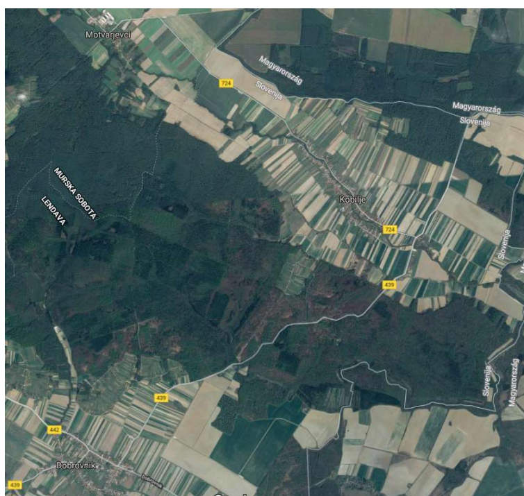
Slika 1: Vas Kobilje s sosednjima vasema in državno mejo

Področje je na V in SV omejeno z državno mejo, vas pa obkrožajo travniki, njive in gozdovi, zato je to področje redko naseljeno in je pretočnost prometa majhna.